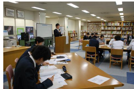
安楽死をめぐるディベート