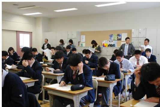
全教科の先生が関わる科学倫理

本講座は、基礎編、応用編、発表編、研究編という授業展開を行い、ひとり一人がきちんとした科学的リテラシーを持たせることを目的としています。内容は、「生命倫理」、「環境倫理」、「科学技術の平和利用」を扱います。