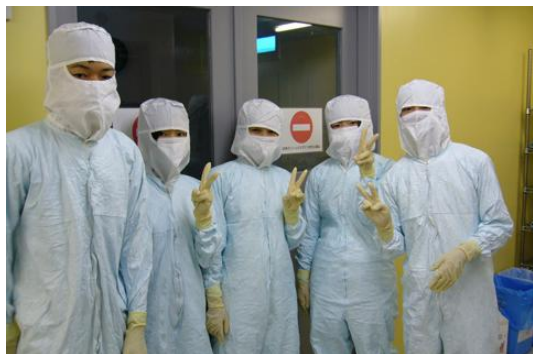
東海大学遺伝子工学実験動物研究センターを訪問