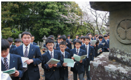
「建学の歌」を歌いました(鉄舟寺にて)

この2泊3日、注意されてしまうこともあったけれど、正しいマナーなどもきちんと学ぶことができました。この合宿で学んだことを生かして、これからの中等部生活に役立てていけるように、きちんとマナーを守って生活していきたいです。