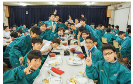
みんな楽しく食しました!