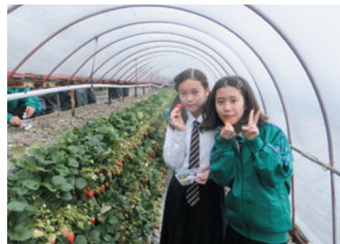
とってもおいしかった「いちご狩り」!