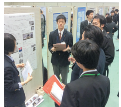
たくさんディスカッションができました

関東近県合同発表会、いろんな面について考えることができよかったです。ありがとうございました。