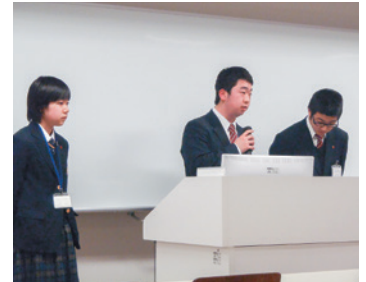
緊張した口頭発表

合同発表会ではとても貴重な体験ができました。私たちは生物についての研究を行い発表しました。こんなに多くの人たちの前で発表しことがなかったのととても緊張しました。発表では大学の教授や研究所の方々から厳しい質問があり、答えられずに苦労しましたが、それらの質問は今後の研究の参考になるので、とても良い機会が持てよかったです。似たようなテーマでも全く違う観点からの発表があり、とても面白かったです。たとえば、私たちは菌の増殖をどうしたら阻止できるかについて研究しましたが、菌を用いて野菜を育てたり、菌が増殖しやすくなる最適の条件を探していたり、さまざまその分野に関しての理解や知識を深めることができました。多くの方々に自分たちの研究を発表し、さまざまな質問や意見をもらうことができました。また、他の人たちの発表を聞き知識も増えました。それらのことを今後、課題実験を進めていく中で参考にして、より良い研究ができるようにしたいと思います。