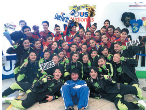
1年生、2年生 2チームFINAL出場