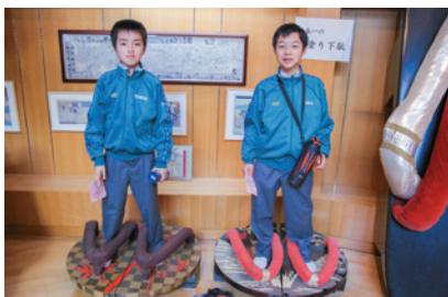
こんなに大きな下駄が!(駿府匠宿にて)