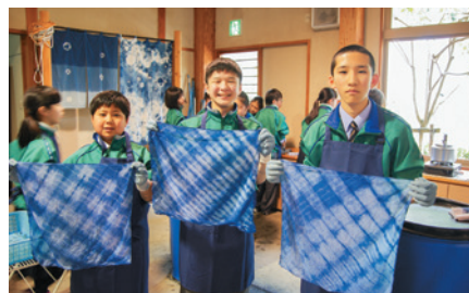
藍染め体験もしました