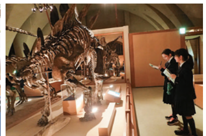
巨大な恐竜に出会いました(自然史博物館にて)