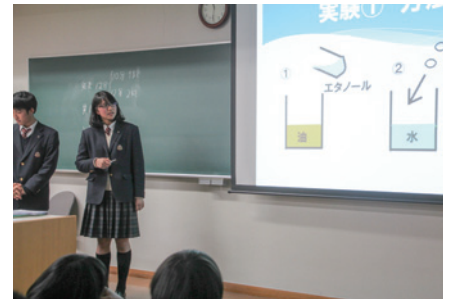
パワーポイントでセッケンの研究を発表しました

今回のように、また良い発表ができるように、研究に力を入れ成果を出していきたいです。