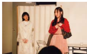
戻りたい? あの時の、あの場所へ