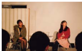
あたしは結婚するつもりだったのに…