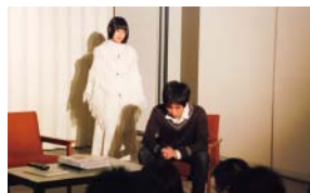
何回やり直したって同じだと思う