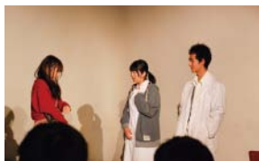
あたしの結婚資金!?