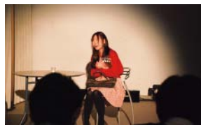
理想のプロポーズは…