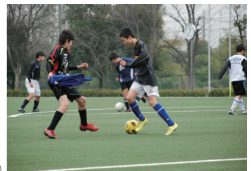
サッカー部(中等部)