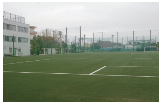
人工芝になった総合グラウンド