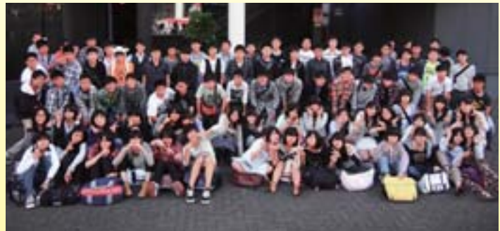
中等部最後の楽しい思い出ができました