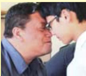
マオリ式のあいさつ