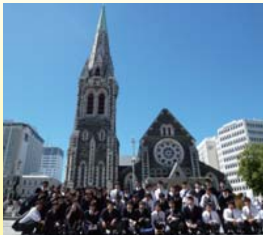
大聖堂をバックに

学生時代にタイムスリップした気分で、優しくユーモアあふれる先生とレッスンを通じて知り合った友人に囲まれ、笑い声の絶えない2時間はあっという間に過ぎます。皆さんもいかがですか？