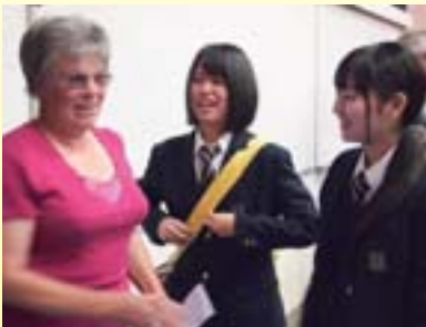
ホストファミリーと対面

ニュージーランドではたくさんの人に会いました。みんなとても優しくて良い人たちでした。また機会があれば行きたいと思います。