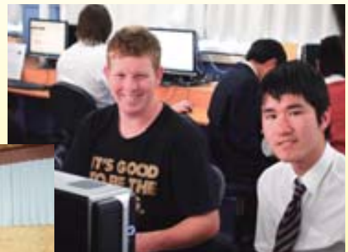
現地校の授業にも参加しました