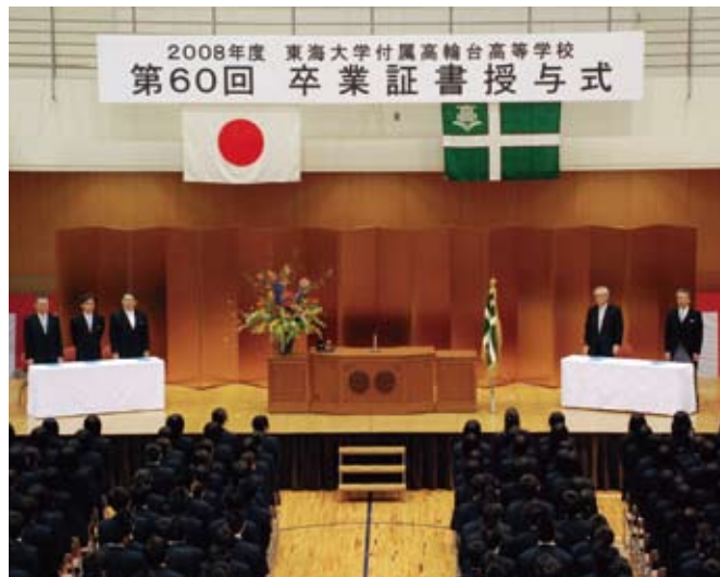
保護者に見守られ、厳粛に行われた卒業証書授与式