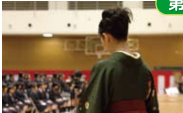
学級担任による個名点呼