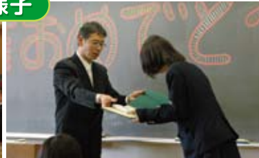
学級担任からの卒業証書授与