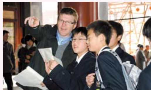
What is that ?