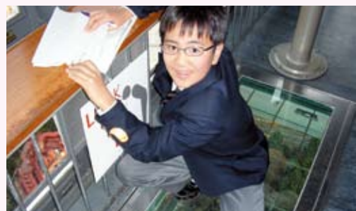
東京タワーのガラスの床! かわいいよ!