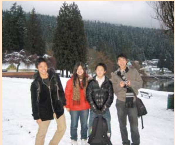
バンクーバー郊外にて

たほうが礼儀正しいなど、普段の授業では聞けないことをたくさん知りました。文化や習慣の違う人との交流はとても楽しく、またその国のことをより深く知ることができました。私はカナダ中期留学という貴重な経験ができたことを嬉しく、また誇りに思います。