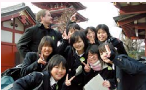
楽しいネイティブスピーカーの先生と!

そして僕達は浅草の浅草寺へ行ってみんなでしおりに載っている店を見つけるために仲見世通りを歩きました。次に上野動物園に行きました。上野動物園には何度も行ったことがありました。動物達を英語で何て言うのか、どういふスペルなのかかわからず、先生に教えてもらいました。最後に東京タワーに行き、しおりに書いてある建物を見つけてしおりに建物のスペルを書いて、その日の行事が終わりました。来年このような行事にまた行きたいなあと思いました。