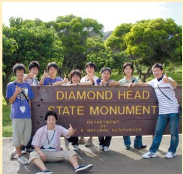
ダイヤモンドヘッドにて

方や自分を表現する仕方など、人間として必要な数多くの重要なことを学ぶ素晴らしい機会であると実感できました。