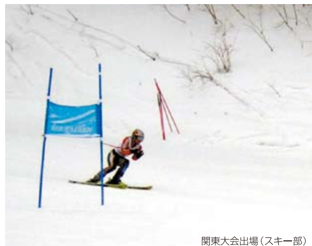
関東大会出場(スキー部)