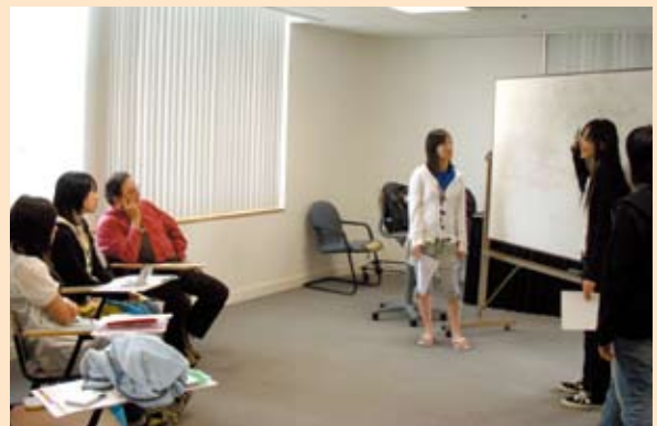
「アメリカンカルチャー」の授業中!!

これからは、学んだことを活かしてもっと海外の人とコミュニケーションをとりたいと思います。