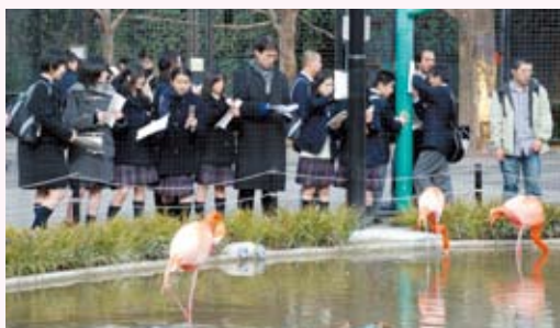
フラミンゴは英語で何て言う?