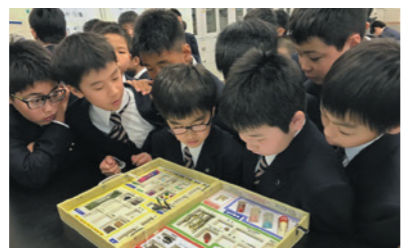
薬物サンプルを見ている様子