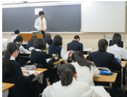
〈HR〉新年度、初心に返って集中!