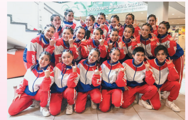
予選で優勝した時の様子

今後もダンスができる環境を当たり前と思わず、今の環境を支えてくださるすべての方に感謝し、1回1回の練習を大切に活動していきます。応援をよろしくお願ひします。