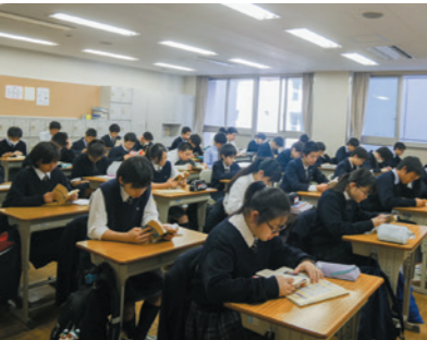
〈朝読書〉静かな中で心が落ち着きます