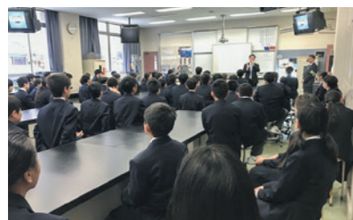
薬物乱用防止講習会