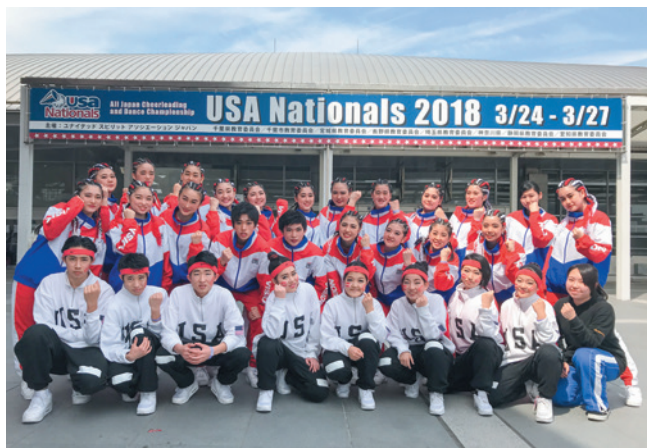
ダンス部 全国大会第3位