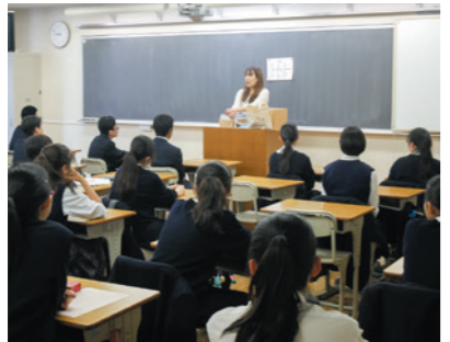
〈HR〉先生の話をしっかり聞いています