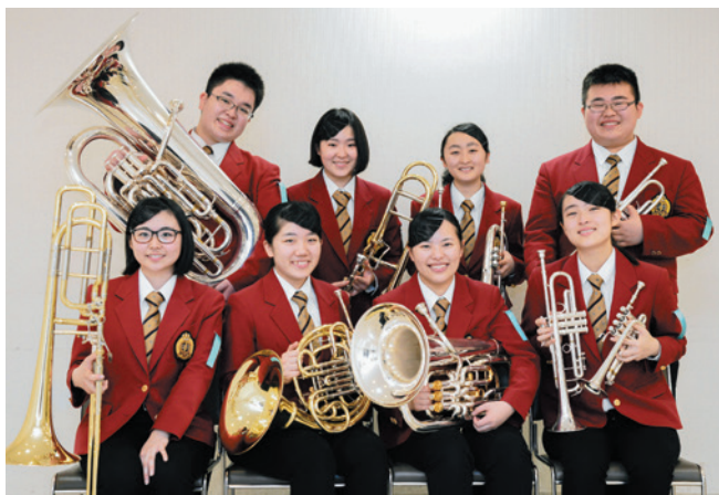
吹奏楽部 金管八重奏アンサンブルコンテスト金賞