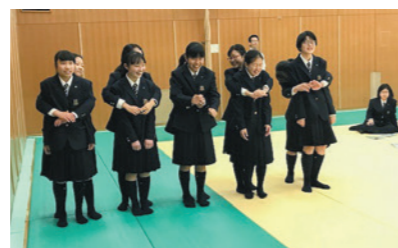
背後から抱きつかれたら…この後両手を上げて逃げる練習