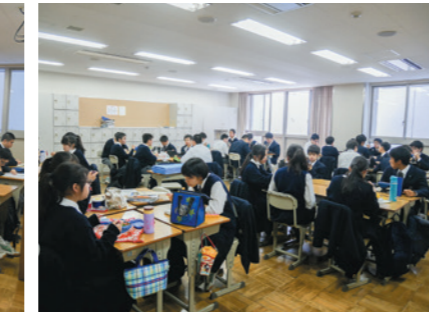
〈昼食〉楽しいひととき!