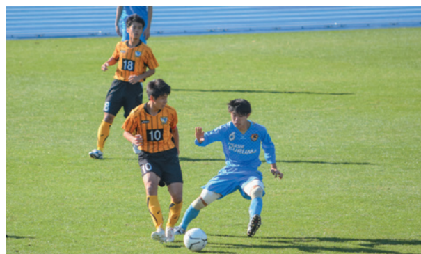
「一つ」になれた高校サッカー選手権(東京予選)準優勝!!