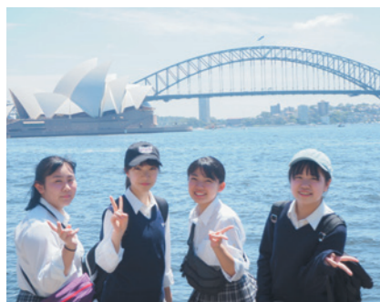
オペラハウスとハーバーブリッジを背景に

ホストファミリーとのホームステイはとても充実したものにできました。言葉が通じない状況でここまでいいものにできたのは、ホストファミリーのおかげだと思います。自分がこの2週間で感じたことや身についたことは主に2つあります。1つ目は偏見や差別に対する考え方が変わりました。今、世界では新型コロナウイルスが流行っています。それでもホストファミリーやパティの人々はとてもよくしてくれました。なので、自分も心のどこかにある差別的な心をなくし改めていきたいと思いました。2つ目は、外国がどのような所かということです。自分は1回も外国に行ったことがなかったので、とてもいい体験になりました。今回のような体験は会社の面接などに役立つと思います。この2週間はとても楽しかったです。