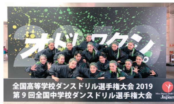
毎年、大活躍のダンス部