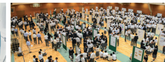
探究活動Ⅱ(ポスターセッション)