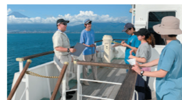
課題実験(夏期集中)