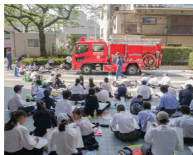
暑いなか集中して描きました