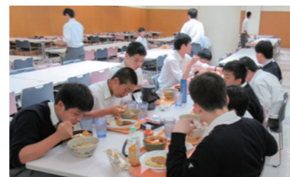
食べ盛り！モリモリ食べます！