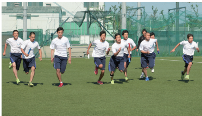
校外活動:スポーツ大会(高2)