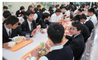
おしゃべりしながら