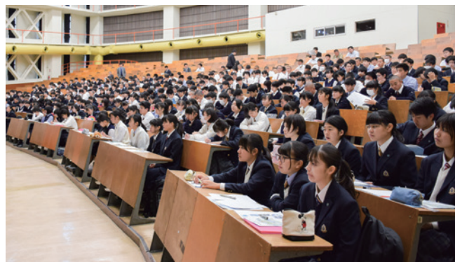
校外活動:湘南校舎見学会(高1)