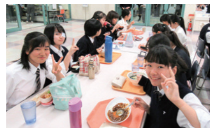
おいしい食事で笑顔になります！