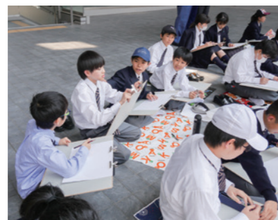
意見交換しながら描いています