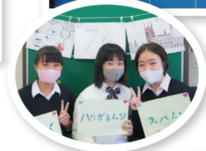
学習成果をクイズ形式で発表♪