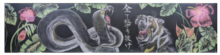
プロ並みのチョーク画!!!

パネルに電飾を使用することで、ゲームとして楽しむだけでなく、視覚的にも楽しめる内容であった点が高評価でした。また、クラスのチームワークが良く、生徒が協力して運営しており、良い雰囲気の中で展示が開催されていた点が高く評価されました。