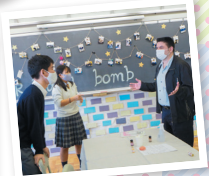
Let's make a bath bomb!