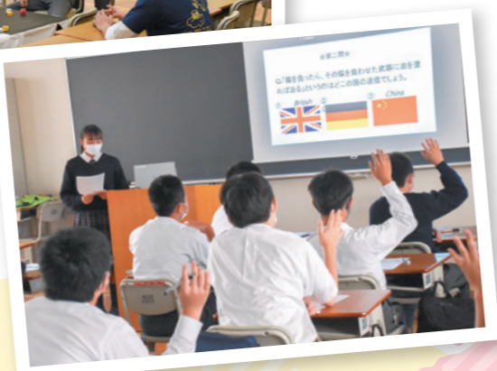
パワーポイントで学習発表