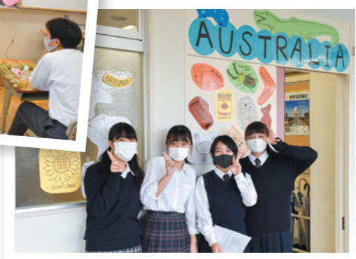
オーストラリアについて英語で発表