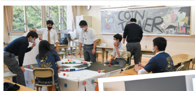
準備期間、知恵を持ち寄り試行錯誤!