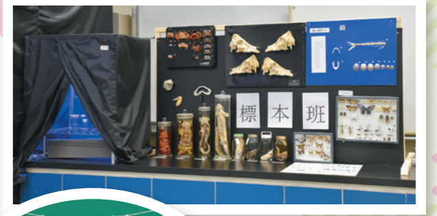
物理化学部の標本展示