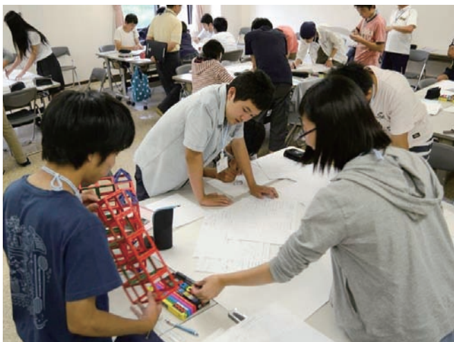
学園オリンピック (数学部門)