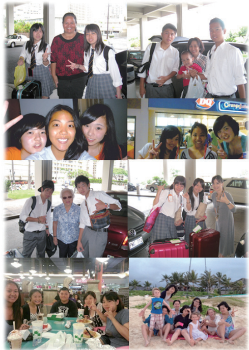
ハワイ・ホームステイコース

私がホームステイコースを選んだのは、ハワイの人々が普段どのような生活をしているのを見られると思ったからです。1日目はなかなか英語に耳が慣れず、聞き取れないところがあったりもしました。2日目の半日が過ぎるころには、日本のマンガや海外の映画などで話が弾んだりもしました。1つの会話からいろいろなことに話題を広げられるのがホームステイの良さだと私は思います。しかし、そこで何よりも身に染みて感じたのが己の英語力の未熟さです。自分にもっと英語力があれば、もっと今回の旅を楽しめたと思っています。ホームステイにおいて最も重要なことは、ホストファミリーに自分のやりたいことをしっかり伝えられるかということだと思います。自分は何が好きで何をやりたいかということを言えることが、いかにホームステイライフを楽しめるかに繋がると思います。共に楽しんだ仲間たち、ホームステイに協力してくださったホストファミリーの方々など、この旅行を支えてくださった皆さんに感謝します。