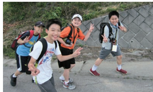
男子も負けていません!