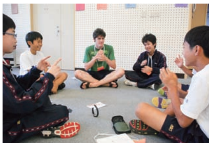
たくさんゲームをして仲良くなりました