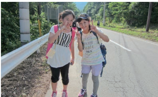
女子先頭グループ。余裕の表情です

長い道のりを2人で諦めずに歩ききれた達成感は最高でした。剛健旅行前に立てた目標「完歩」は2人で一緒に達成した一生心に残る思い出になります。今回のことを忘れずに、次回の剛健旅行を楽しみにしていきたいです。