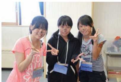
カーニバルでは、顔にペイントをしてくれました