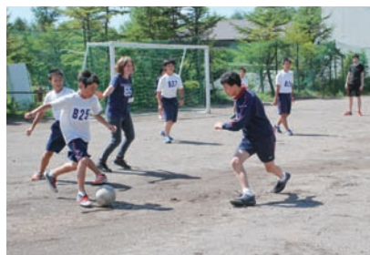
スポーツは世界共通です!!