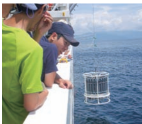
海洋水質調査の見学

私はこの活動で、初めて体験することがたくさんありました。船に乗ったり、シュノーケリングをしたり、島に行くのも初めてでした。このような経験、体験ができてためになりました。そして、今回の活動を通し学んだこと、経験したことを今後の研究活動に生かしていきたいです。