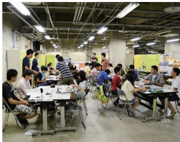
学園オリンピック (理科部門)