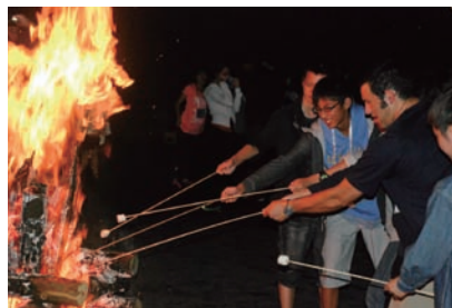
キャンプファイアーでマシュマロを焼いて食べました