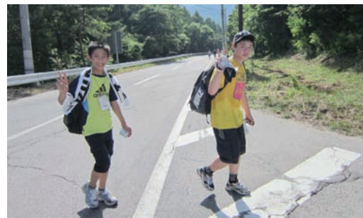
2人で完歩、おめでとう!