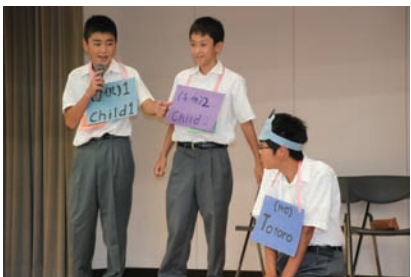
英語で劇を作りみんなに披露しました