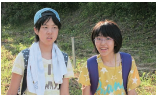
後半組もリタイアせずに頑張りました