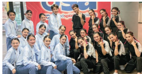
ダンス部：USA Japanチャアリーディング&ダンス学生新人大会2021 EAST