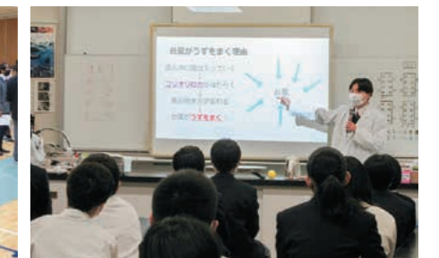
サイエンスコミュニケーター活動