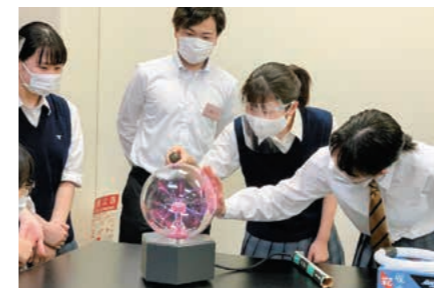
プラズマの体験(協力:慶應義塾大学)

《協力先》 京浜ドック(株)、東洋物産(株)、(株)プラントピオ、(株)うみどり、(株)ヤマリア、(株)シンジ、日本海洋事業(株)、(株)不動産トラ、エム・テックス(株)