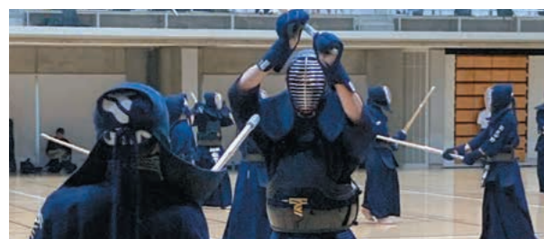
剣道部：インターハイ練習会場での様子