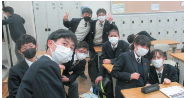
3年生になっても頑張ります!