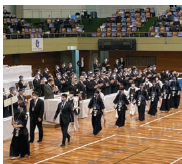
いざ、全国の舞台へ