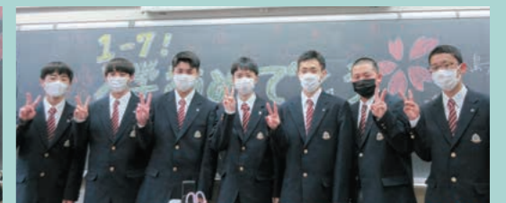
部活動に勉強に頑張ります