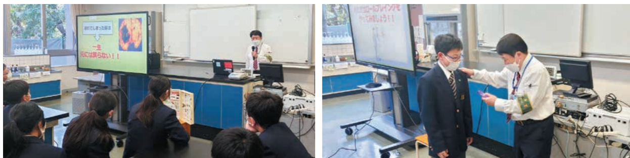
薬物乱用防止講習会

4月6日に校内オリエンテーションを行いました。各クラスのHRでは、自己紹介や学級担任によるアイスブレイク等が行われ、クラスメイトとの交流を深めました。また、警視庁から講師の先生をお招きし、「薬物乱用防止講習会」と女子生徒対象の「痴漢防止講習会」を実施しました。