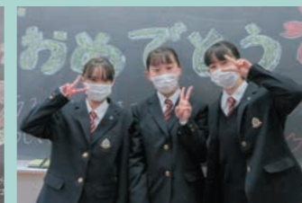
新生活が楽しみです