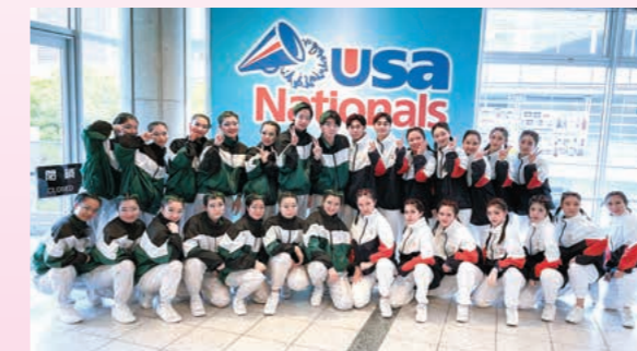
2チームとも全国大会出場を果たした2年生!

高校2年生2チーム・3年生1チームは、3月24日に幕張メッセで行われた全国大会に出場させていただきました。2年生2チームは惜しくも入賞することができませんでしたが、3年生は3位に入賞することができました。2年生にとっては初めての大会にもかかわらず、予選出場した2チーム共に全国大会へ出場できたことはとても嬉しく思います。コロナ禍で練習が止まってしまうこともありましたが、2年生の頑張る姿を見て3年生も頑張ることができ、ダンス部全体で切磋琢磨することができました。コロナ禍にもかかわらず会場で演技できたこと、先生方や友達や家族などたくさんの方々に応援していただいたこととても感謝しています。3年生の目標である全国大会優勝を果たせず、悔しい結果となってしまいました。しかし、今回の大会を通して全国大会で優勝したチームの演技を見ることができました。今回の悔しい気持ちを生かし、感謝の気持ちを胸に、夏大会での優勝を目指して高校ダンス部・中等部ダンス同好会一同頑張ります。これからも応援をよろしくお願いいたします。