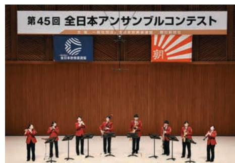
心をひとつに演奏