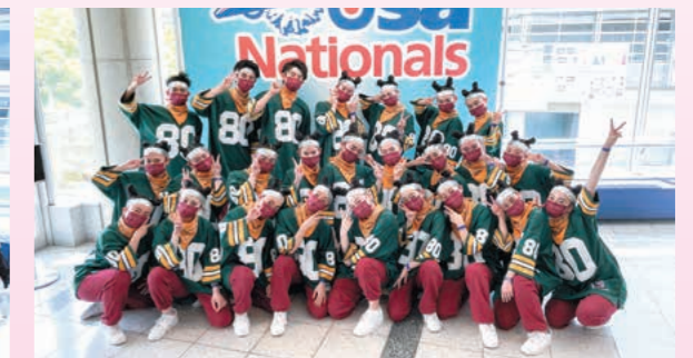
全国大会3位に輝いた3年生!