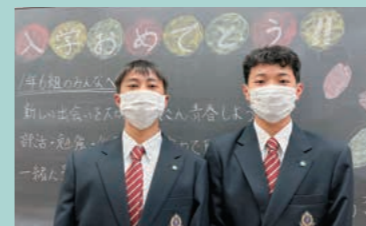
入学式を終え安堵の様子です

私はサイエンスクラスに強く惹かれたため、サイエンスクラスを志望しました。そう思った動機は、自分が思い描く理想の姿を高校3年間で見つけていきたいと思ったからです。さまざまな体験を人より多く経験できるという利点を、自分のこれからの人生にも生かしていきたいと考えました。また、私は数学が得意であり、一番好きな教科であるので、理系に特化したクラスで数学について深く勉強したいと思います。その上で自分の目標として文武両道を掲げ、平日頃から精進していきたいです。