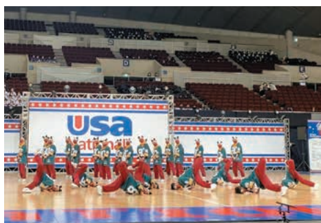
久しぶりに観客の前で