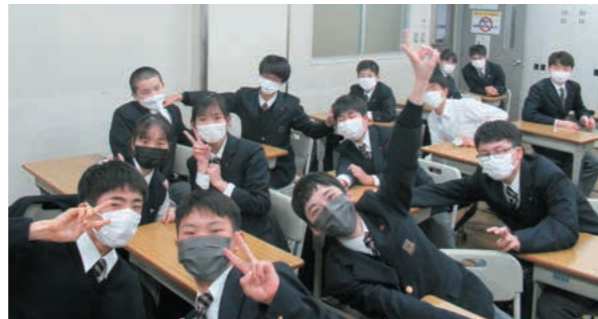
クラス替えしても仲よし

部活動面ではゲームキャプテンとしてチームを引っ張り、最後の大会で港区1位を取るつもりです。そして東京都大会に出場して、誰よりも多く点を取ることが今の目標です。また、チームのみんなと最後まであきらめずにやり抜き、笑顔で終わらせたいです。そのためには、基本の勉強を怠らず常に試験勉強への対策をし、ゲームキャプテンとして部員を引っ張れる存在として学校生活を過ごしていきたいと思います。指導に当たってくださる先生方や周囲の人たちに感謝の気持ちを持って、中等部最高学年として生活していこうと思っています。