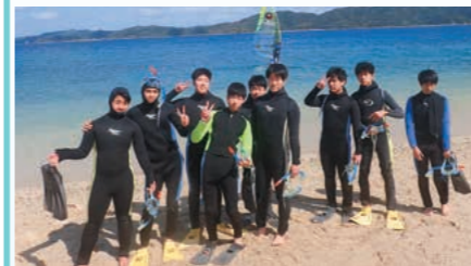
シュノーケリング旧A組

私が奄美大島で学んだことは、異文化の地であることです。奄美大島は日本ではありませんが、本州にはない動植物が存在したり、言葉も異なっていました。特に興味深いのが方言です。最初は福島県のような訛りだと思いましたが、時々大阪のような訛りもあり、たくさんの文化が取り込まれていました。奄美大島は私たちが住んでいる地域とは異なり、いろいろな国に取り込まれていた多文化の宝庫でした。