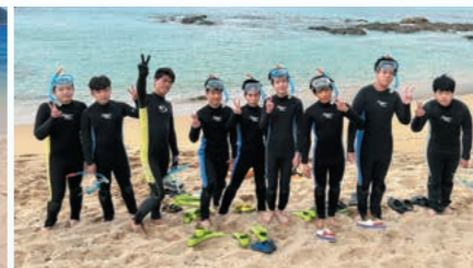
シュノーケリング旧B組