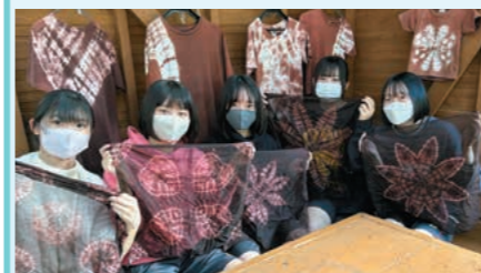
泥染め体験 ~きれいなハンカチできました~