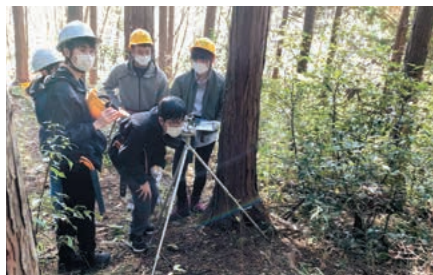
森林フィールドワーク(サイエンス基礎)

《発表先》 SSH生徒研究発表会(神戸国際展示場)、東京都内SSH指定校合同発表会、東海フェスタ(名城大学附属高等学校)、マスフェスタ(大阪府立大手前高等学校)、Japan Super Science Fair(立命館高等学校)、白梅科学コンテスト、関東近県SSH指定校合同発表会、核融合科学研究所オープンキャンパス、山形県立東校学館高等学校、新潟県立新潟南高等学校、福井県立若狭高等学校、兵庫県立豊岡高等学校、兵庫県立姫路東高等学校