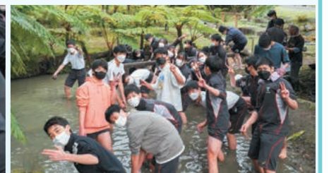
泥染め体験 ~足がヒヤッと~