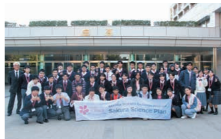
さくらサイエンスプログラム