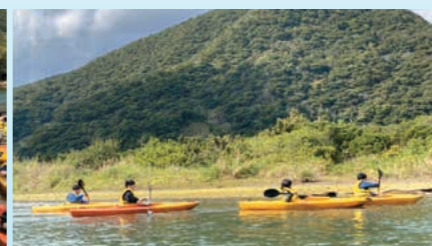
カヌー体験 ~大自然を満喫中~