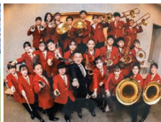
中等部吹奏楽部 東日本大会