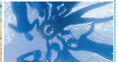
きれいな海の中から