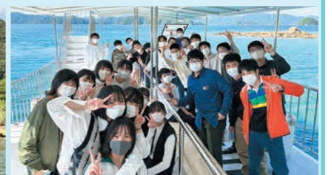
水中観光船せとに乗船中