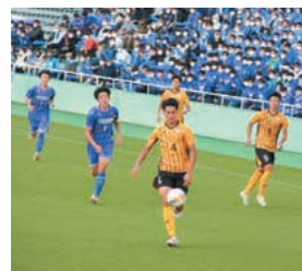
サッカー部：全国サッカー一選手権