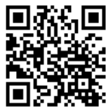
写真アップロード