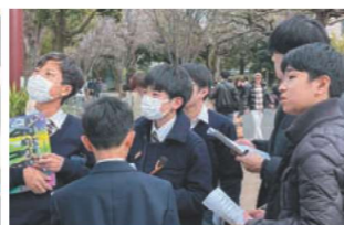
Which animal can you see?