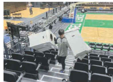
横浜エクセルシオの試合会場設営をお手伝い