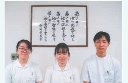
看護体験を終えて

当日は、本校卒業生の看護師の方にお会いすることができたことも有益であった。看護学科進学が激化する今日、「一日看護体験」に参加した生徒たちは、看護職というものをどのように受け止めたのであろうか。