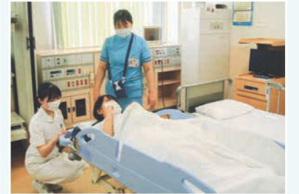
ストレッチャー体験