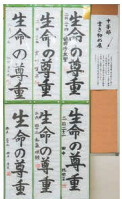
1月 書き初め展(優秀者の6人)