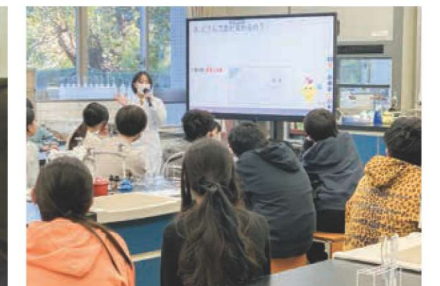
港区立高輪台小学校6年生を対象とした科学の体験授業