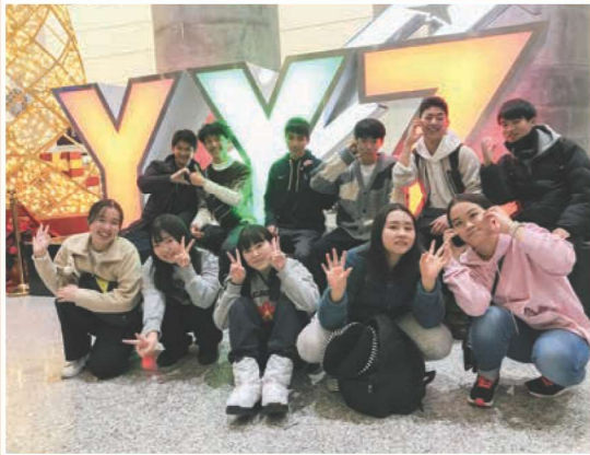
トロントピアソン国際空港での集合写真

本校では進学先の決まっている高校3年生(希望者)が参加することのできる海外留学プログラムとして、学園主催のSHIP(ハワイ中期留学)と本校が独自に行うカナダ中期留学を用意しています。今年度は合わせて12名の生徒がプログラムに参加して、さまざまな経験を積んできました。