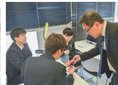
ヨネックス株式会社法務室による知的財産教育