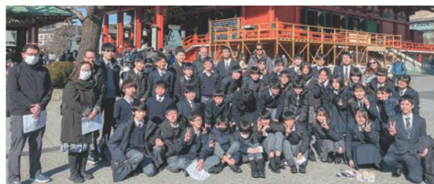
Class A Sensoji Temple

今回のTokyo Sightseeing Tourを通して、たくさん学ぶことができました。わからない単語があると、ネイティブスピーカーの先生たちが発音や言い方をわかりやすく教えてくれました。日常ではなかなか英語で会話する機会がないので、たくさん英語で会話することで多くのことを学べたと思います。また、浅草観光では、ワークシートにわかりやすく絵を描くことができとても楽しかったです。