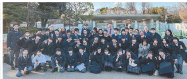
Class B Ueno Zoo