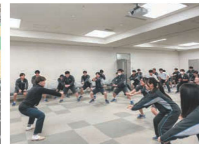
川崎ブレブサンダースからチームスタッフがご来校