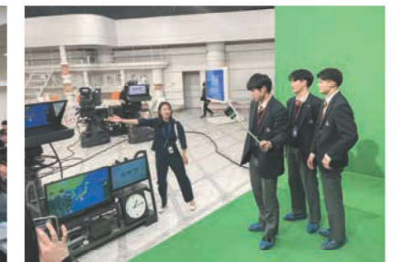
TBS放送センターを訪れ、ニュースや天気予報の裏側を見学!