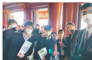
The precincts of Sensoji Temple