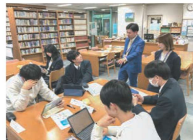
ブルデンシャル生命保険のライフプランナーによる金融セミナー