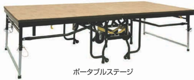
ポータブルステージ