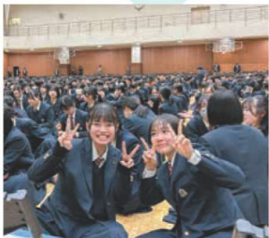
始業式開式前にニコリ