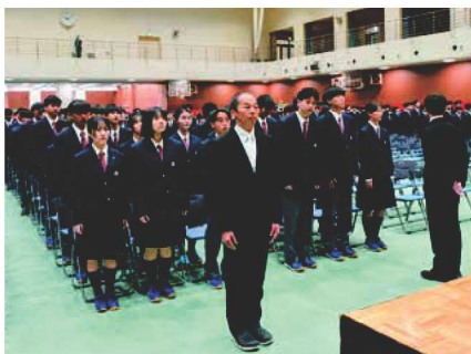
吹奏楽部の生演奏の中、入場