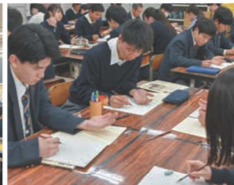
芸術選択の授業が加わりました