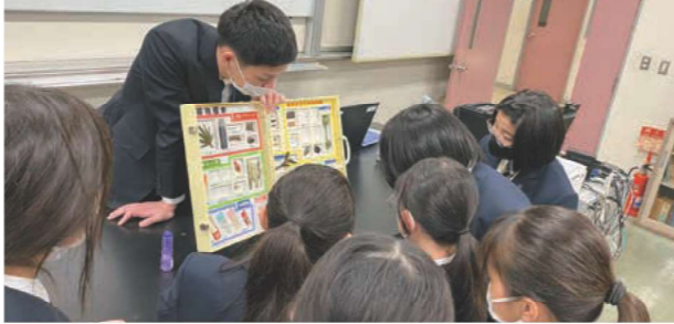
警察の方の説明をしっかりと聞いていました