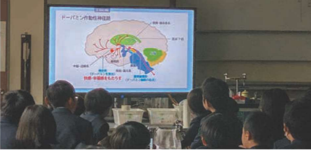
薬物乱用防止講習会