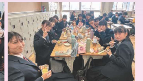
みんなで仲良くお弁当