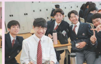
いい笑顔でポーズ!