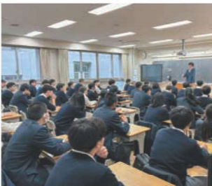
新クラスで気持ちを新たに