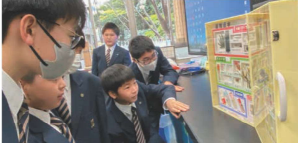
薬物のサンプルをじっくり観察