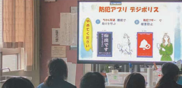
痴漢防止のアイテムを学びました